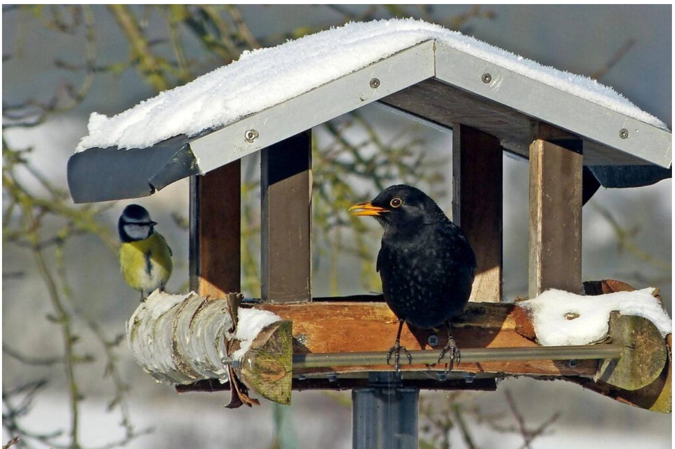
Ein Futterhaus mit einer bunten Mischung an Körnern und Weichfutter zieht im Winter zahlreiche Wildvögel an.

vielfältig, um den Bedürfnissen mehrerer Vogelarten gerecht zu werden. Außerdem ist oft minderwertiger Weizen enthalten, der kaum Abnehmer findet und nutzlos im Futterhäuschen liegen bleibt. Doch auch die restlichen Inhaltsstoffe sind nicht für alle Vogelarten gleichermaßen geeignet. Denn diese fressen bei weitem nicht nur Körner und lassen sich grob in zwei Futtervorlieben einteilen. Während die einen vorwiegend Weichfutter fressen, das sie in den wärmeren Jahreszeiten vom Boden aufpicken, bevorzugen die anderen vor allem Körner und Samen. Dazwischen gibt es die sogenannten Allesfresser, die nicht allzu spezialisiert sind. Dazu zählen zum Beispiel Kleiber, Meisen und Spechte. Ihnen schmeckt vieles, auch die typischen im Handel erhältlichen Futtermischungen. Schwieriger wird es, die Futtervorlieben anderer Arten zu treffen.