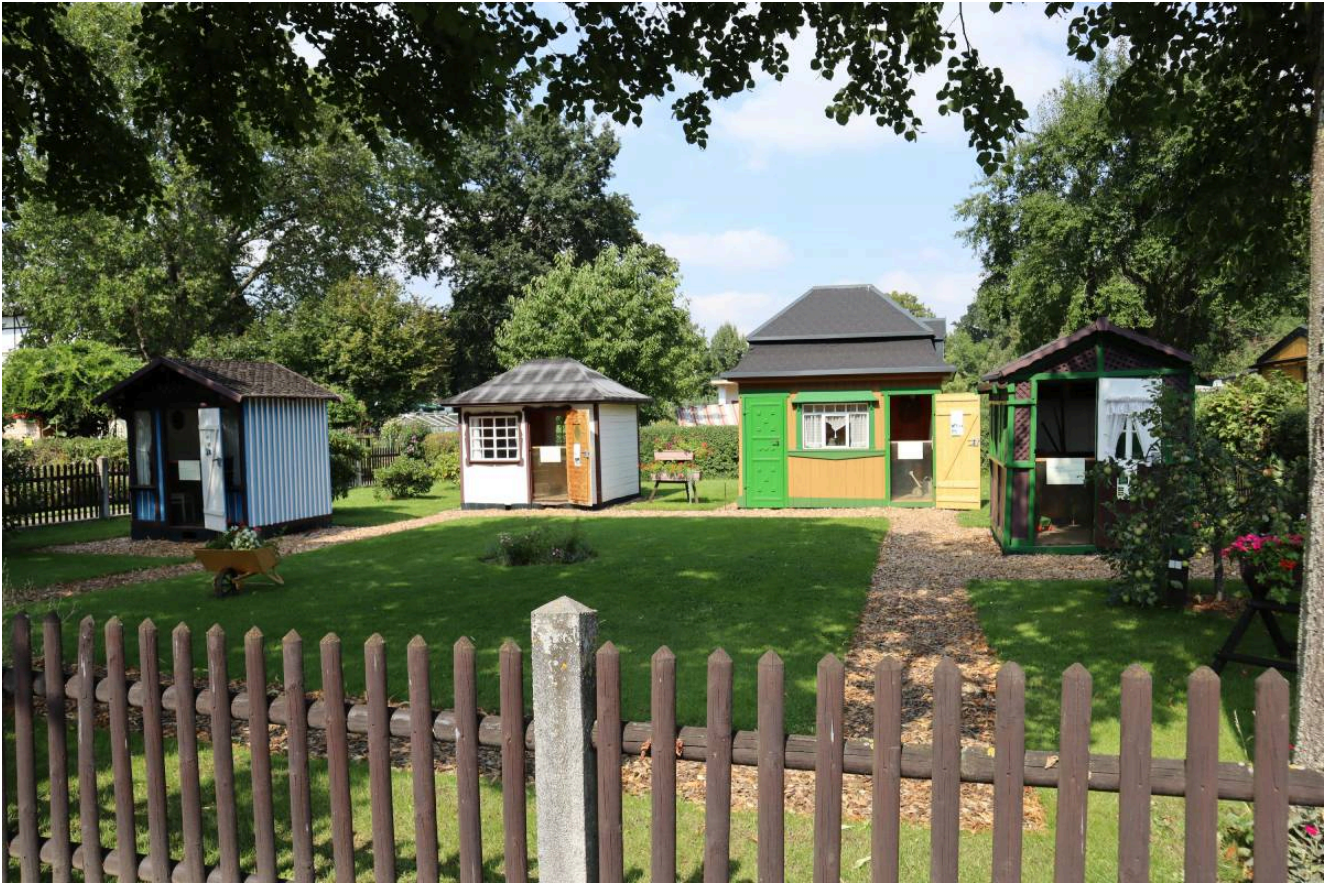
Laubengarten – (1)