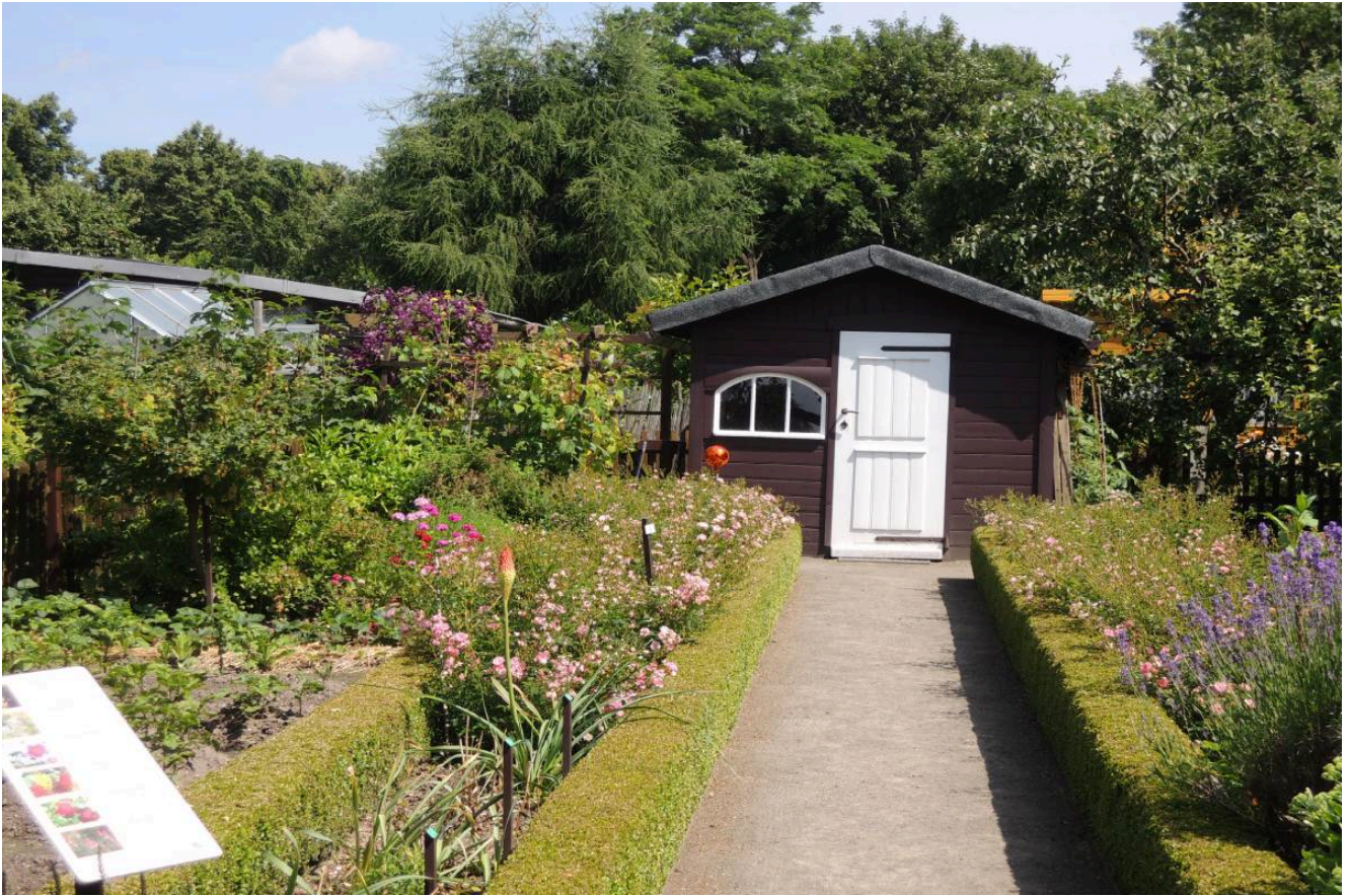
Museumsgarten – ©Kleingärtnermuseum Leipzig (3)