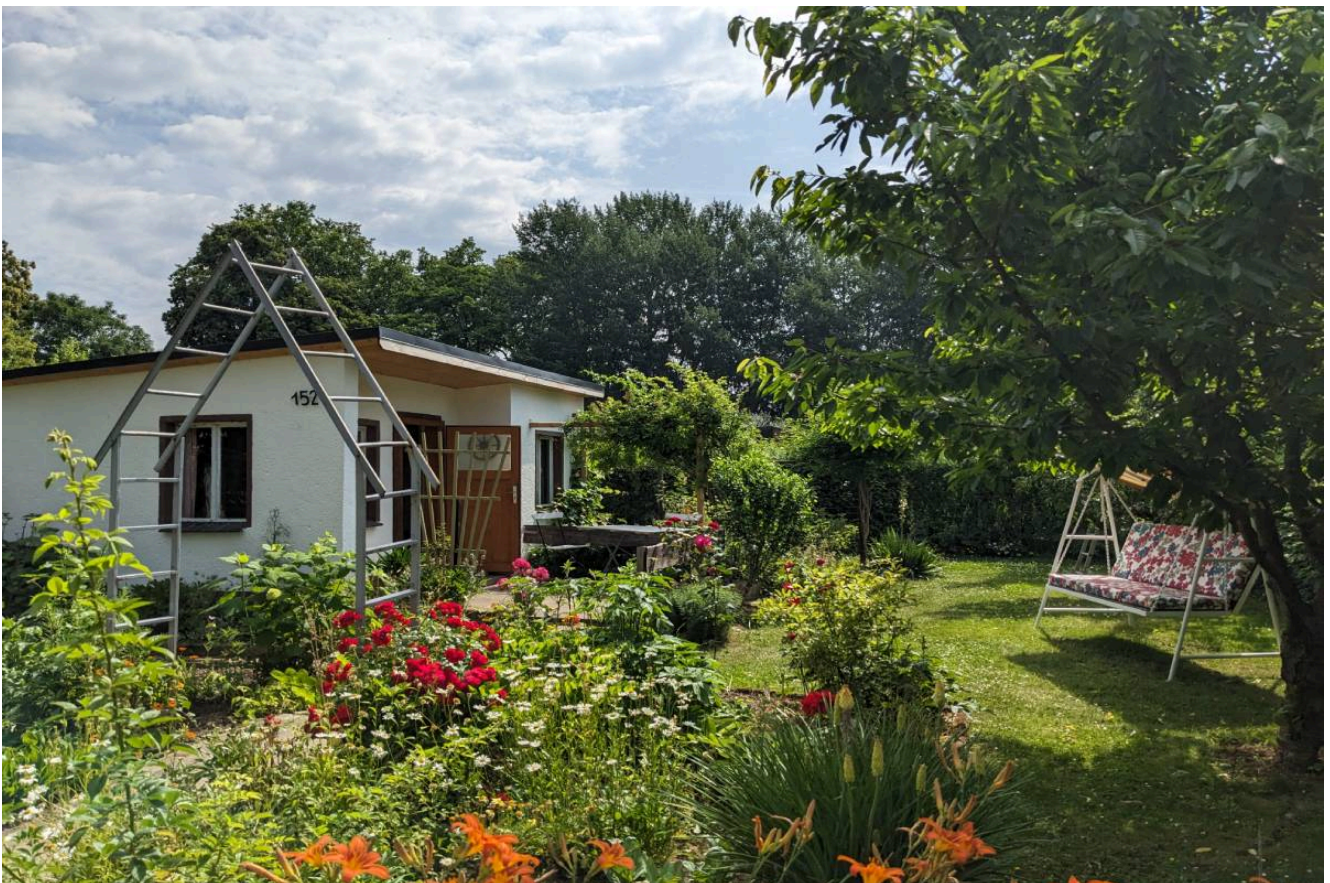
DDR-Garten – ©Kleingärtnermuseum Leipzig