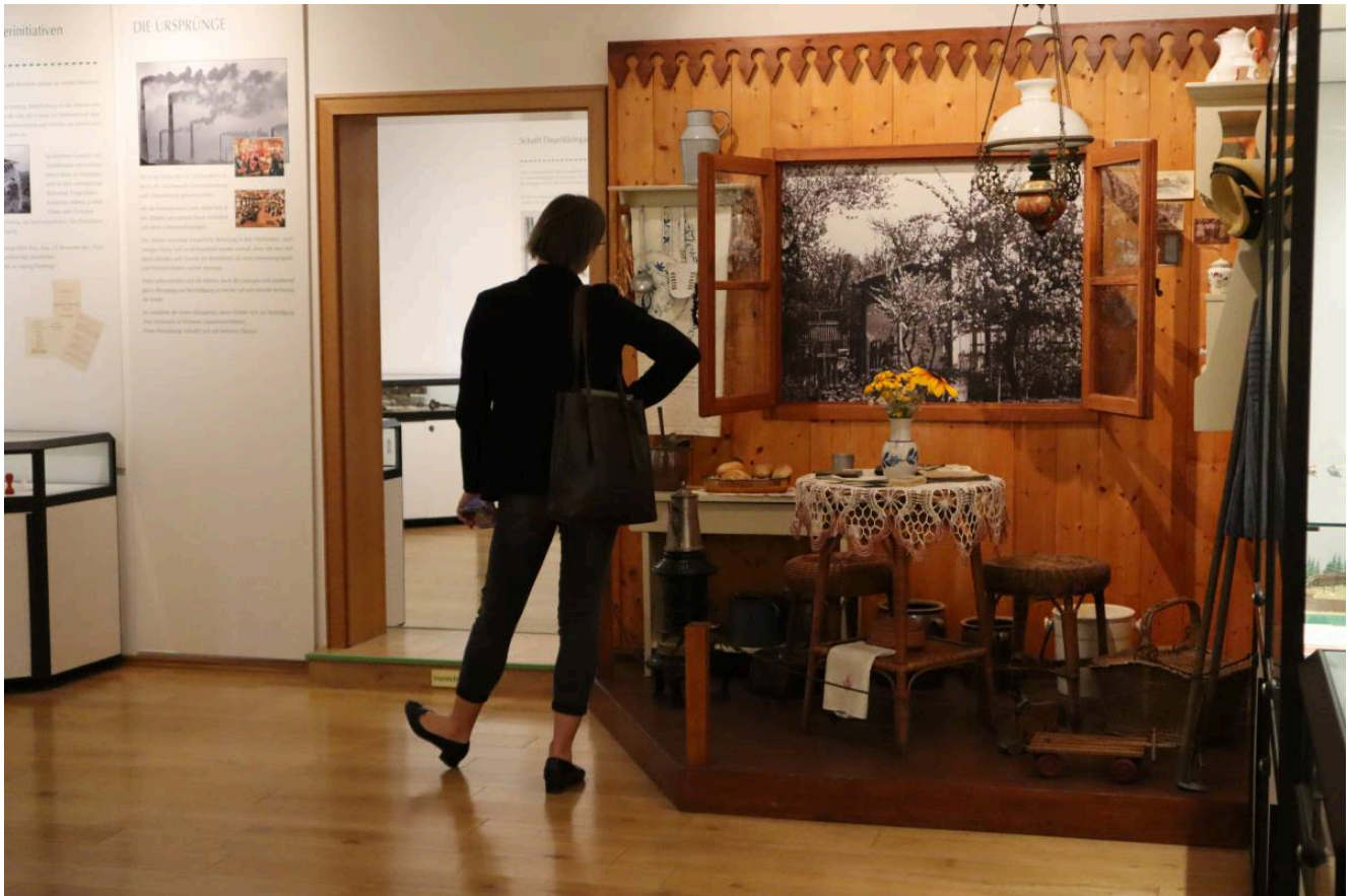
Dauerausstellung – ©Kleingärtnermuseum Leipzig (1)