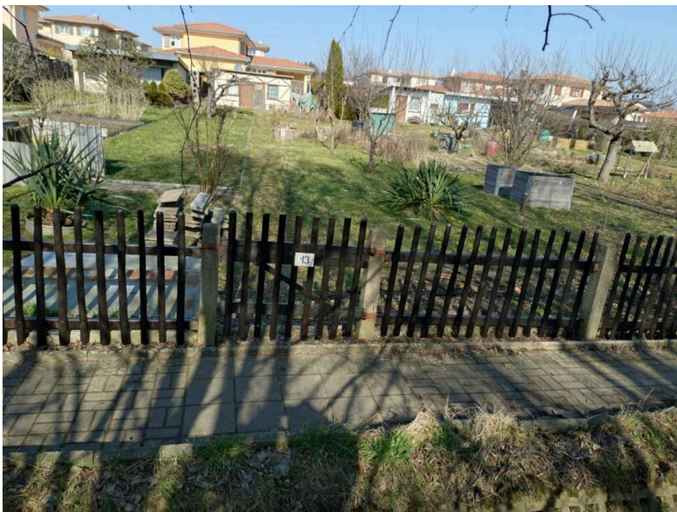
Aus Parzelle 13 wurde der neue Gemeinschaftsgarten mit vier abgeteilten Bereichen

Im August 2024 stand fest, dass wir uns der Herausforderung stellen wollen. Es gab erste Arbeitseinsätze zur Urbarmachung des Gartens inklusive Lauben Beräumung. Im September 2024 haben wir in der Mitgliederversammlung unsere Idee den Gartenfreunden vorgestellt und das Einverständnis aller eingeholt. Hinter so einem Projekt sollten alle stehen. Es gab weitere Vorbereitungen in der Parzelle, und die Freude auf die Umsetzung wuchs.